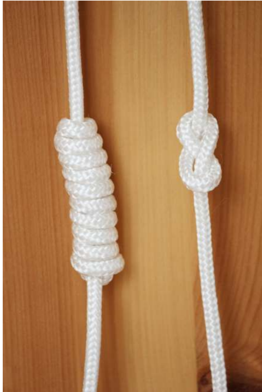
✓ węzeł prosty (stoper)